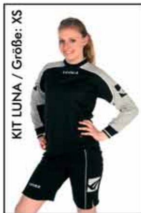
KIT LUNA / Größe: XS